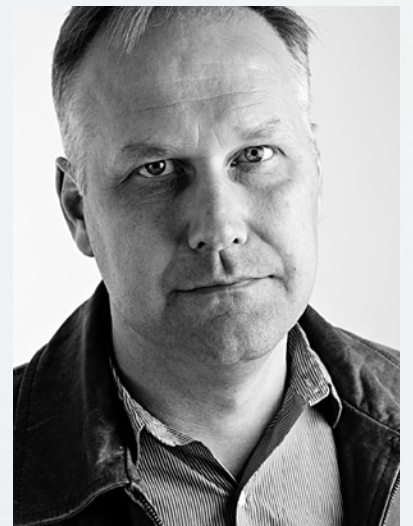
Jonas Sjöstedt vill minska våra utsläpp av växthusgaser.

– Vi tror inte på kärnkraften som lösningen på klimathotet. Vi vill istället ersätta den farliga kärnkraften med helt förnyelsebara energikällor som till exempel vindkraft, solenergi, biobränslen och moderniserad vattenkraft. Dessutom kan vi spara el genom att använda modern teknik. Vi behöver inte kärnkraften om vi satsar rätt. Kärnkraften i sig orsakar också miljöproblem både vid uranbrytning och avfallshandling. Och alldeles oavsett att kärnkraften är miljöfarlig så